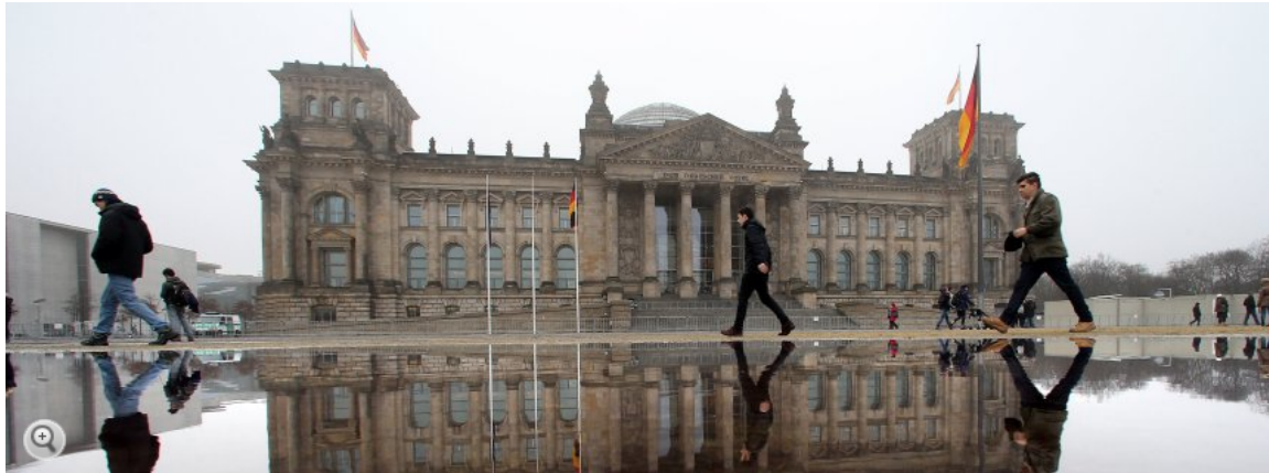
Reichstagsgebäude in Berlin: Angriff aus Russland?